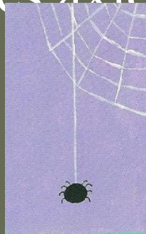
Emotion en l'absence de croyance axiologique contingente