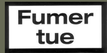
Croyance axiologique sans émotion contingente